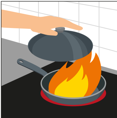
ኣብ ድስቲ ሓዊ እንተ ተላዲሉ፡ ብመኽደኒ ክደኖ። ፈጻምካ ማይ ኣይጠቐም።