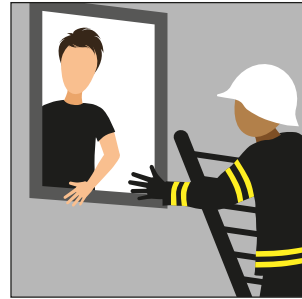
ኣድላዩ እንተ ኸይት፡ ካብ ገዛ ክትውጽእ ኣገልግሎት ምድሓን ኪሕግዙኻ ይኸእሎ'ዮም።