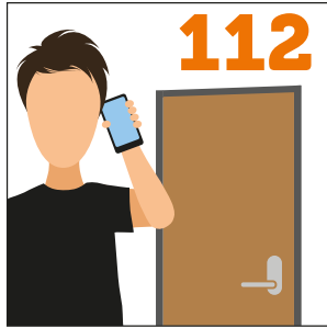
ማዕጾ ዕጾው ኪኸውን ኣለዎ። 112 ደውል።