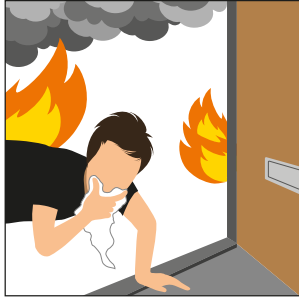
ሓዊ እንተ ተላዒሉ ንደገ ውጻእ።