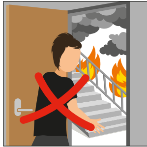
አብ መደያይቦ (መሳልል) ትኪ ኣሎ'ዶ፡ ካብ ገዛ ኣይትውጻእ።

አብ ትኪ ዝመልእ መደያይቦ (መሳልል) ፈጻምካ ኣይትውጻእ። ሓዊ እንተ ተላዒሉ፡ መደየቢ (ሂስ) ፈጻምካ ኣይትጠቐም። ገዛኻዩ ዘተኣማምነካ።