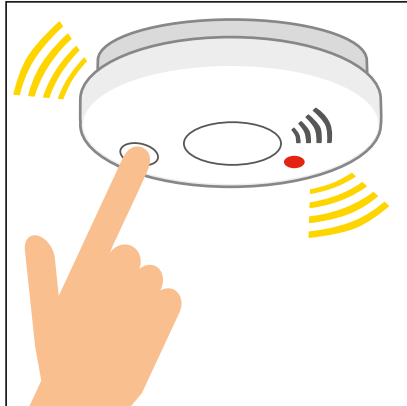
ነቲ መጠንቀቂ ባርዕ ሓዊ ዚሰርሕን ዘይሰርሕን ንምፍላጥ ቡብእዋኑ ፈትኖ።